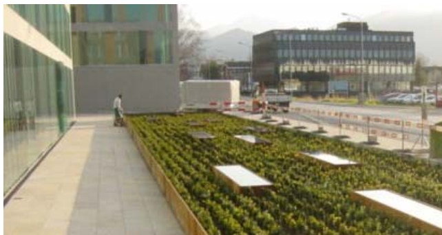
Heckenfeld neben dem Haupteingang

Arbeiten: KV. Leistungsverzeichnis und Bauleitung, QS, Ausmass und Abrechnung