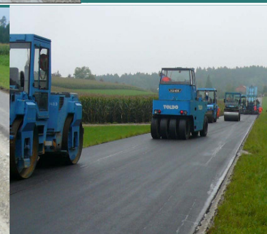
Belagsersatz und Einbauzug