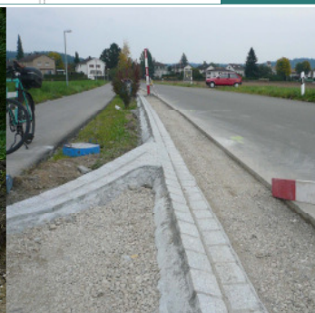
Totalersatz Oberbau Neue Abschlüsse längs Grundwasserschutzzonen