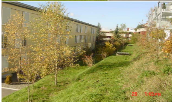
Wiesenterrassen Seite Nord