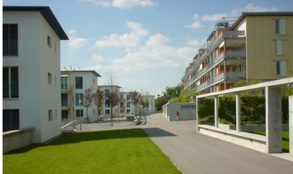
Paseo mit Kinderspielplatz Seite Ost