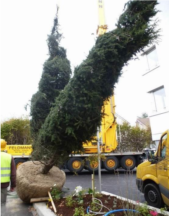
Pflanzarbeiten zum Teil mittels Pneukran über Wohngebäude