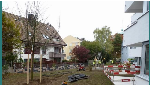
Wertlegung auf Anschlussdetails wie z.B. Schachtdeckelauskleidungen