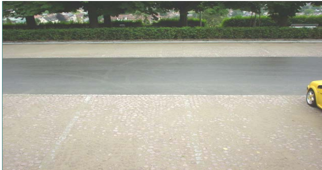
Wiederverwendung der bestehenden Pflasterung