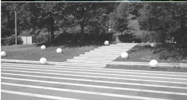
Kehrplatz vor dem Haupteingang