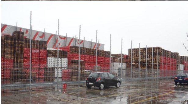
Zaunarbeiten in Ausführung Höhe 6m