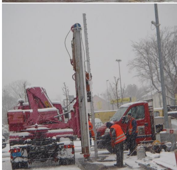
Leitplankenbau in Ausführung bei widrigsten Wetterbedingungen