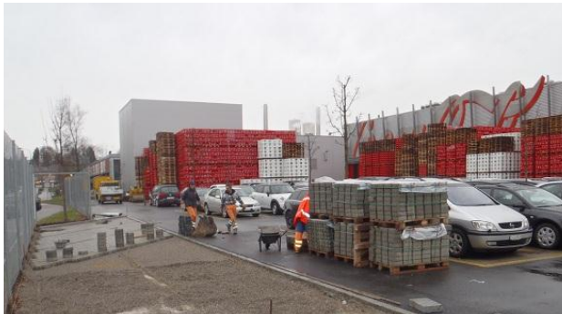
Strassenbau in Ausführung Neue Parkfelder und Fahrbereiche

Arbeiten: Konzept- und Projektplanung, Submission, Bauleitung, Ausmass, Abrechnung